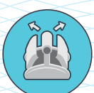
Přístup k filtrům z vrchu