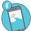
Ovládání pomocí Smartphonu